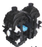
Connecteur multipolaire 2 dérivés 50-240 / 2x10-35M/50M*