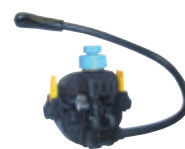
Connecteur de neutre 2 dérivés 50-120M / 2x10-35M/50M*