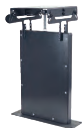
Pied support ParkBridge (GE263)