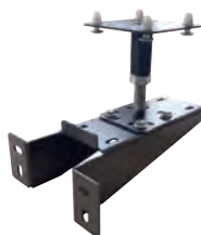
Support mur ParkBridge (GE264)