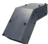
Coude vertical à 45° convexe (GE270)