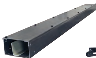
Cheminement ParkBridge (GE260)